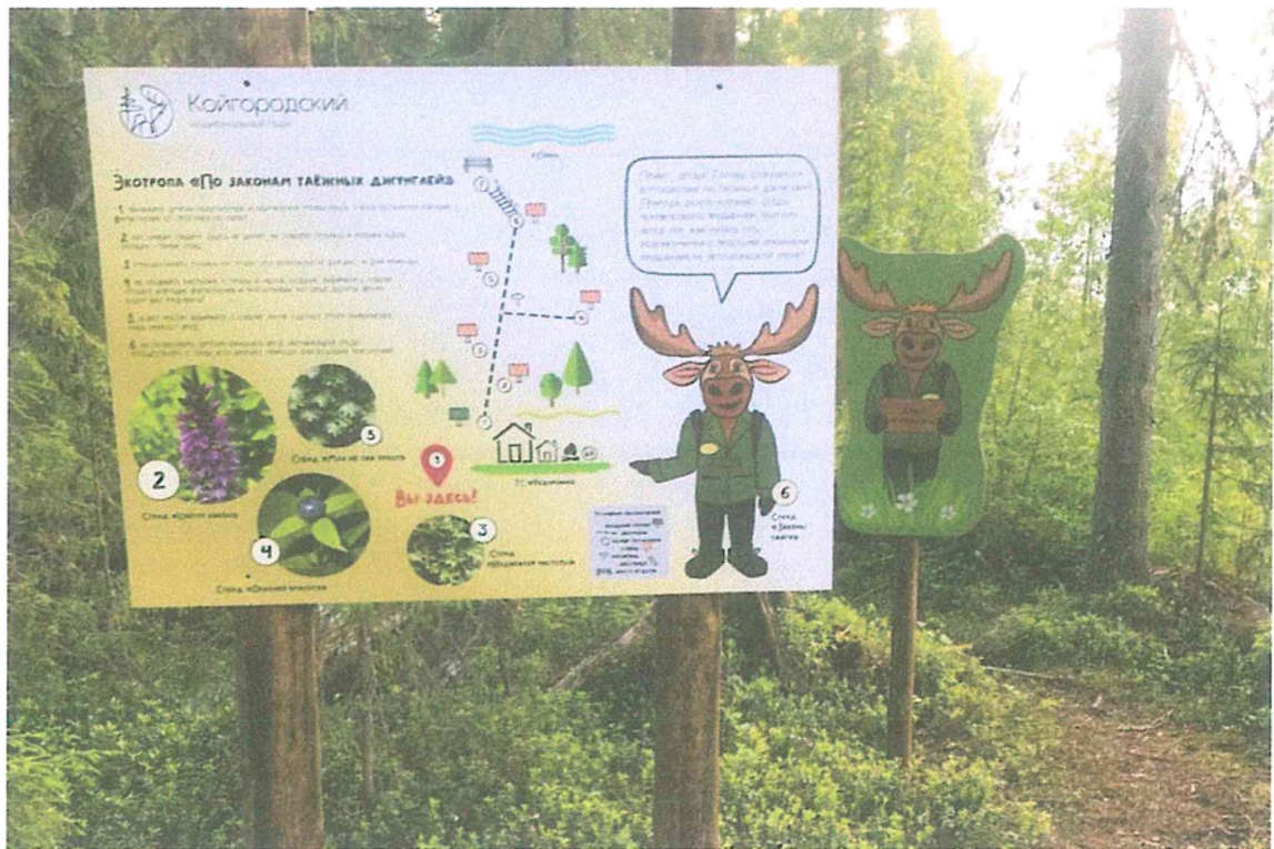
Фото 9. Информационный стенд «Экотропа «По законам таежных джунглей».