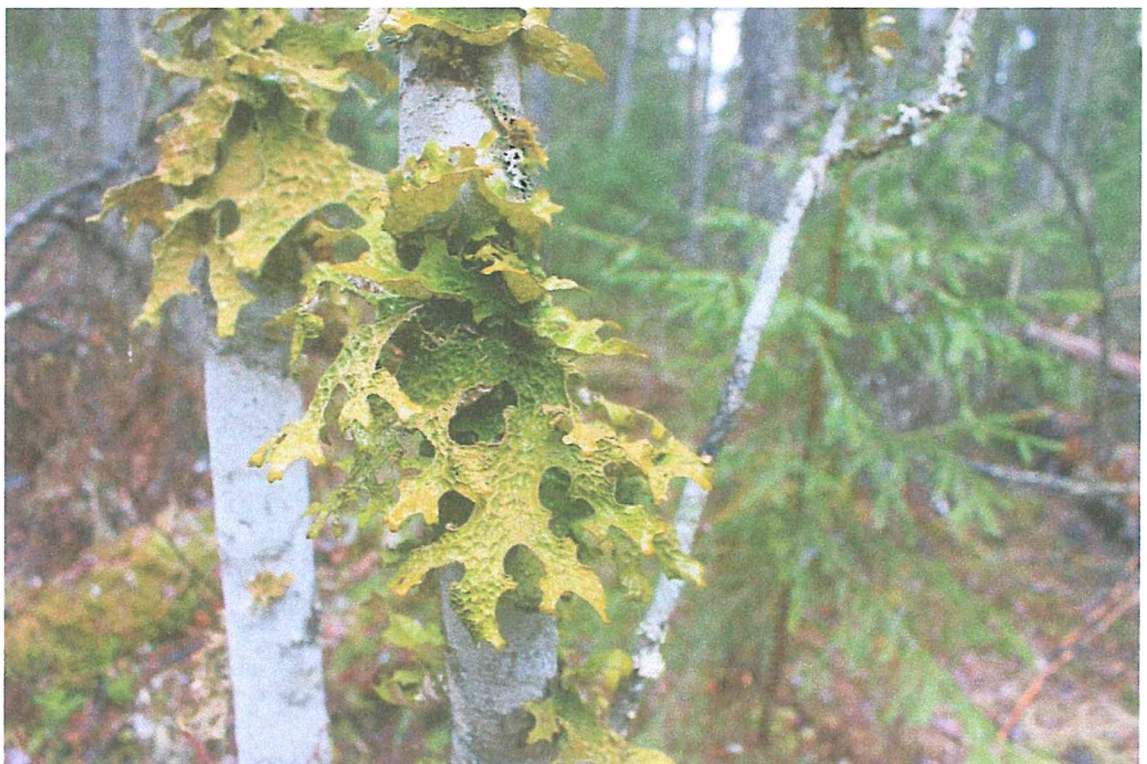
Фото 8. Лобария лёгочная.