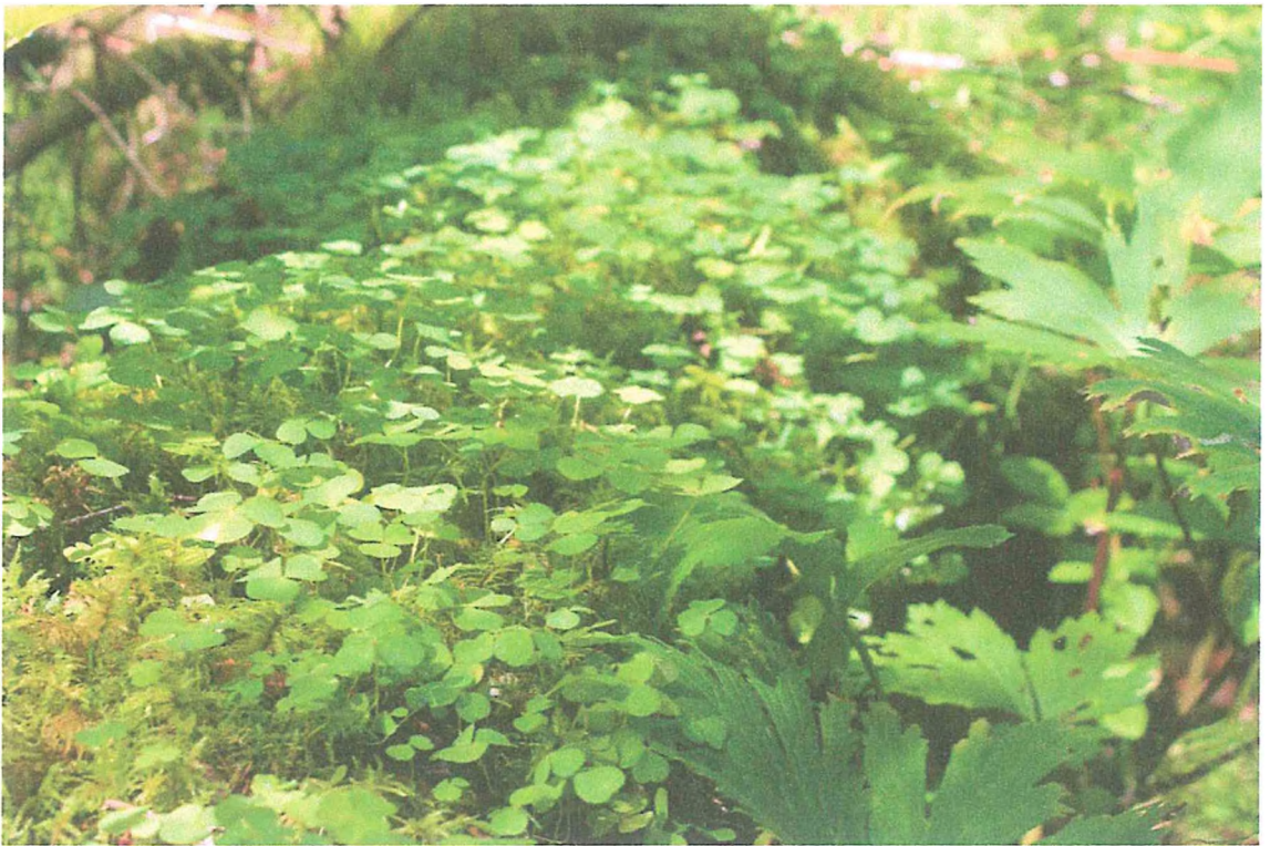
Фото 6. Кислица.