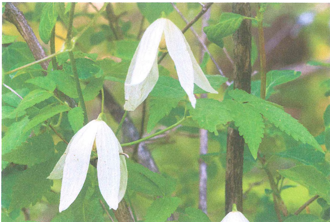
Фото 1. Княжик сибирский.