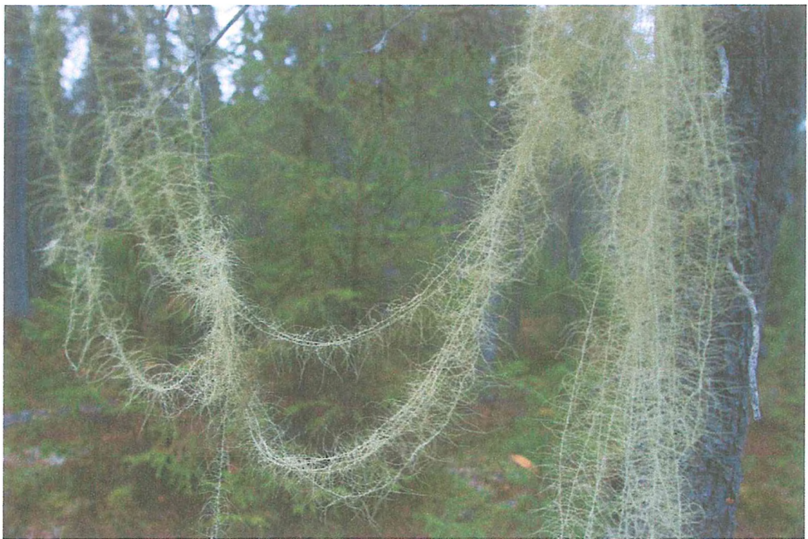
Фото 7. Уснея длиннейшая.