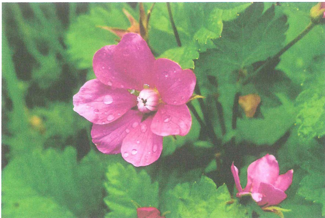
Фото 3. Княженика.