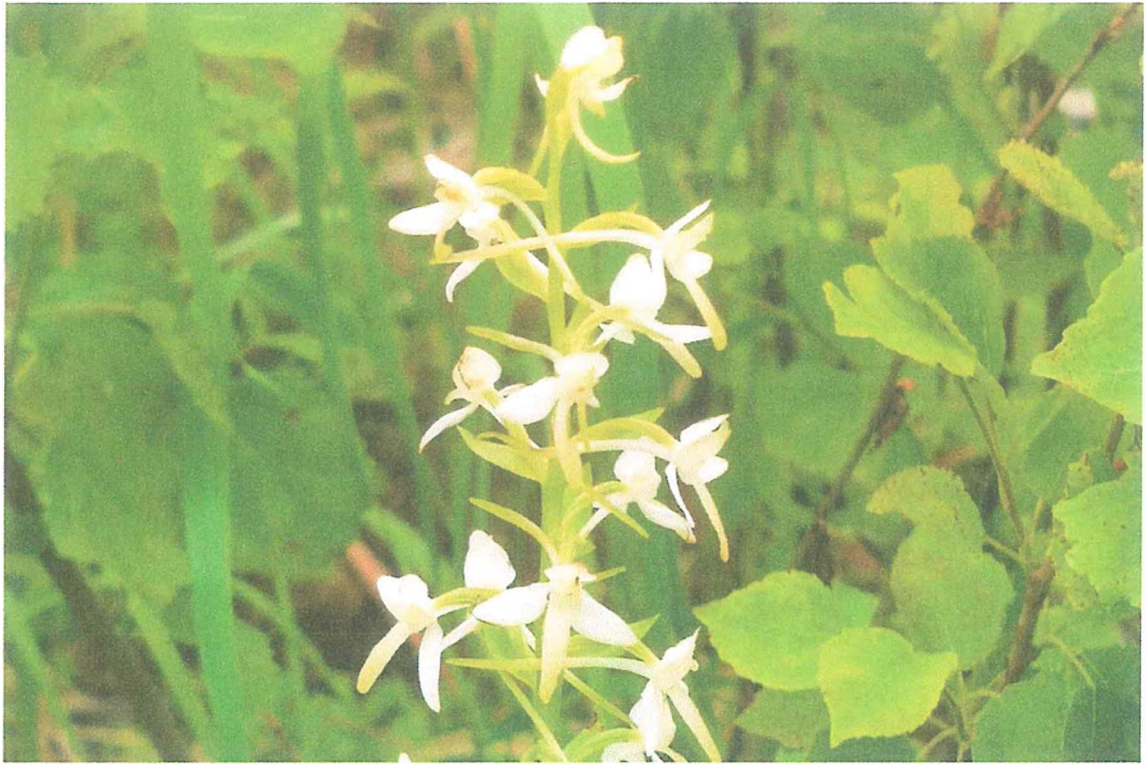
Фото 5. Любка двулистная.