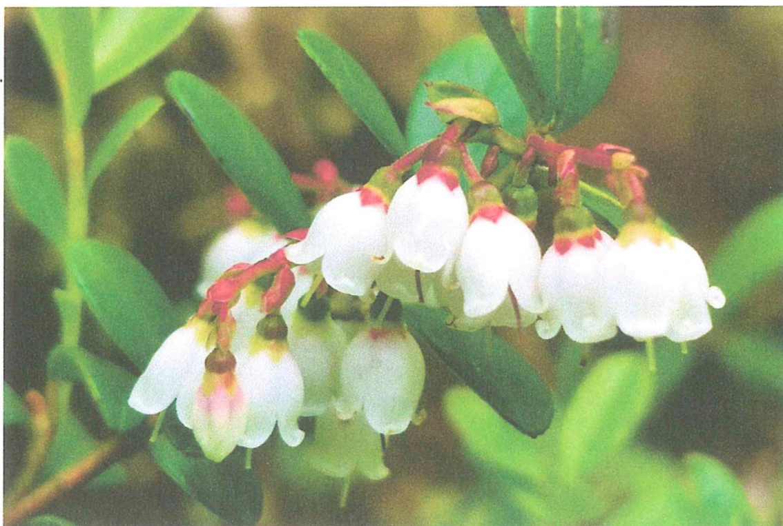
Фото 4. Брусника.