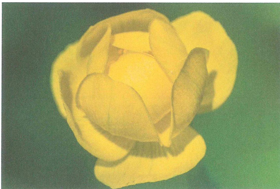
Фото 2. Купальница европейская.