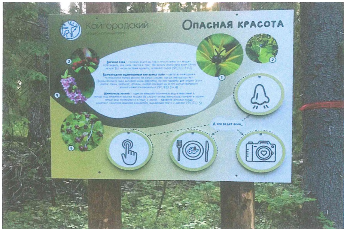
Фото 10. Информационный стенд «Опасная красота».