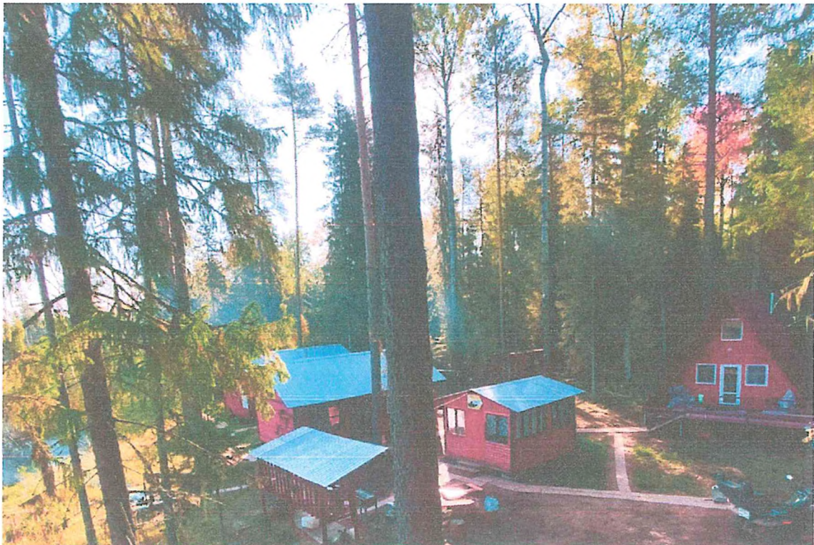
Фото 6. Туристский приют «Фёдоровка».