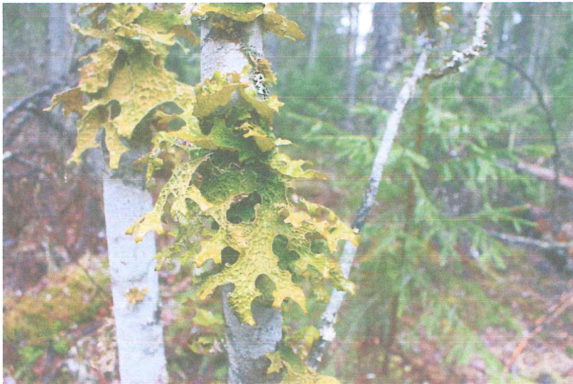
Фото 4. Лобария лёгочная.