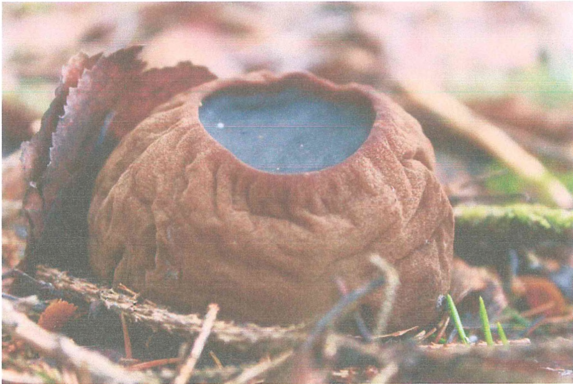
Фото 3. Саркосома шаровидная.