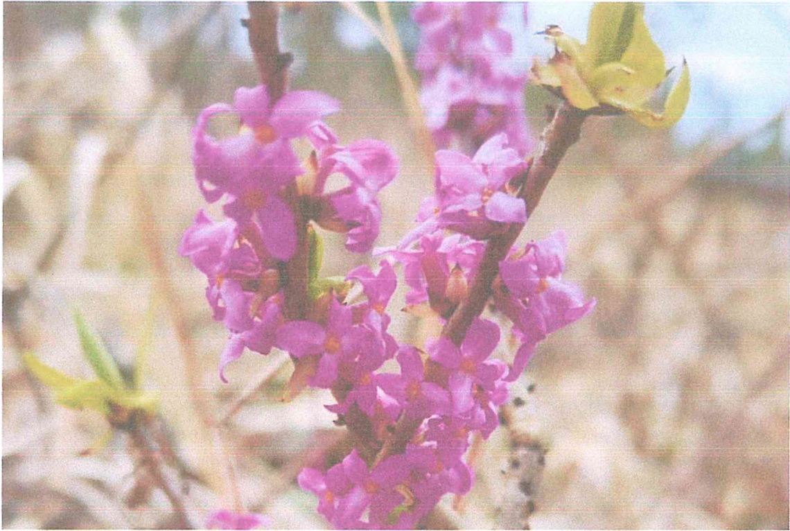
Фото 5. Волчегородник обыкновенный или волчье лыко.