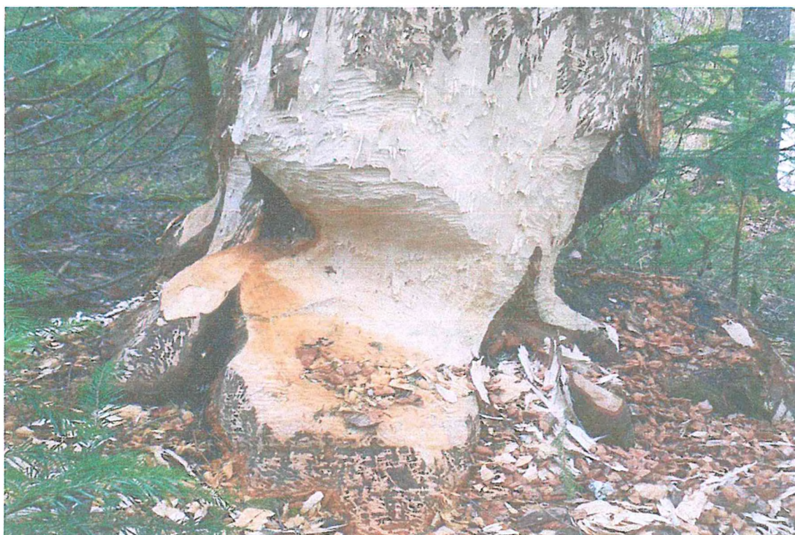
Фото 2. Погрыз бобра.