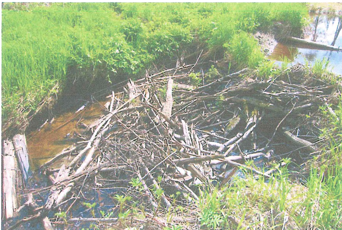
Фото 1. Бобровая плотина.