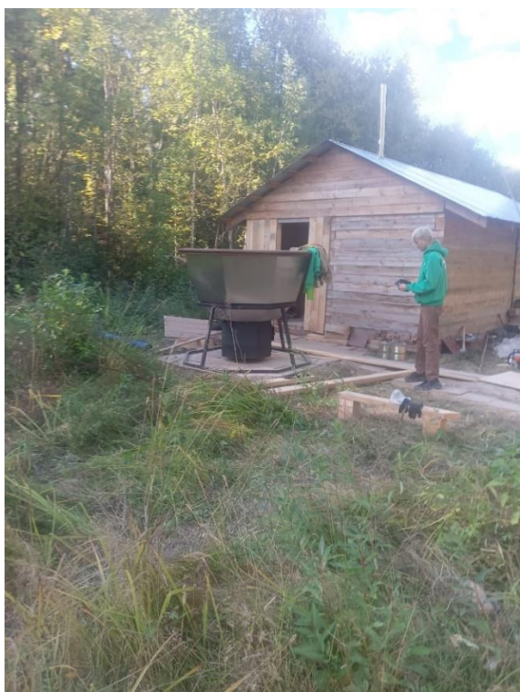
Баня, сибирский банный чан